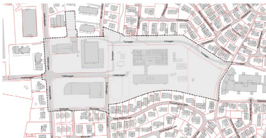
Figur 2 Kart som viser planområde for plan 0517.00

Planområdet omfattet i utgangspunktet BF10, BF11, F11, og F12.