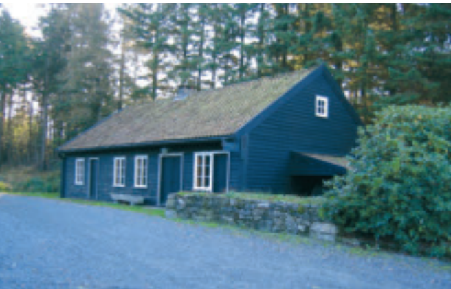
20. Smie - Kverneland, gnr. 28/9, obj. 1121/006/056. Smie frå 1878/79, bygd av O. G. Kverneland. Bygd for produksjon av landbruksreiskapar. Smia viser starten på det som seinare har utvikla seg til å bli ein av dei største landbruksindustriane i verda. Autentisk grunnform. Planteikning manglar. Grunnlaget for produksjonen i smia var utnyttinga av vasskrafta frå Stemmen (Frøylandsåna). Bygningen ligg for seg sjølv, og er bedriftsmuseum. Privat eige. SEFRAK A