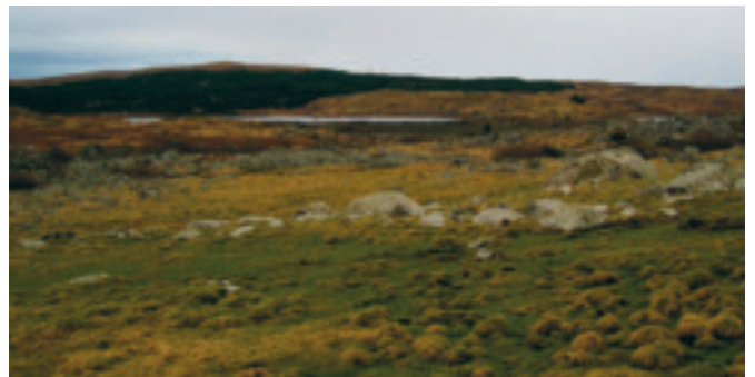
Mot Storamos og Synesvarden

7. Mossigemarkene - Lendemyrane. Dette er kanskje det største myr- og utmarksområdet på Låg-Jæren med små tekniske inngrep. Området ligg som eit lågt ope platå med låge moreneryggar. Her finst det framleis restar etter torvskjæring, og det er større område med røsslynghei.