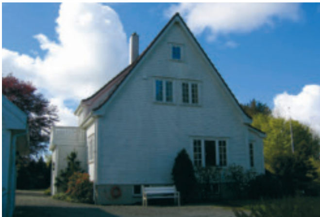
22. Bustadhus , Bryne, gnr. 2/41, obj. 1121/007/007. Bygd i 1917-18 i klassisisme. Seinare påbygg med veranda på baksida av huset bryt med opphavleg stil, elles stor grad av autentsitet. Fin representant for dåtidens "finare" byarkitektur. SEFRAK A