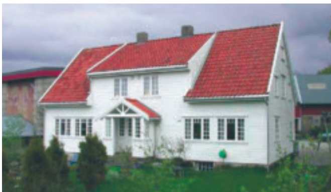
56. Fotland - gnr.58/1 - våningshus på Fotland, bygd 1846. Staseleg gardshus som er pietetsfullt restaurert av nåv. eigar. Kulturvernprisen 2006. KPL