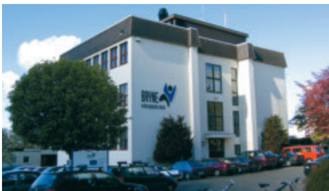
42. Steinbakken - gamlebygget ved ved tidlegare Rogaland Offentlege Lands gymnas, nå Bryne vgs - Staten, gnr. 1/290. Bygd 1947. KPL