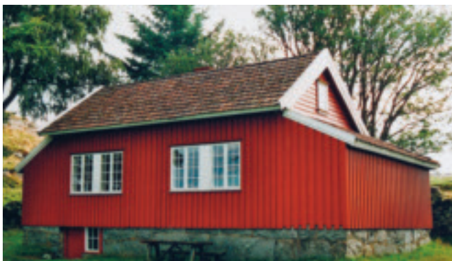
k. Knudaheio , Undheim, gnr. 46/21, obj. 1121/005/095. Sommarhuset til diktaren Arne Garborg. Bygd i 1899. Lite jærhus med 2 skutar. Autentisk grunnform og - plan. Til Time kommune i 1924. SEFRAK A (19) og SOB