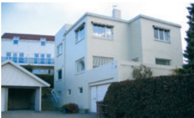
41. Ingelin - bustadhus i funksisstil, gnr. 1/243. Bygd av Olav Garborg i 1935. KPL