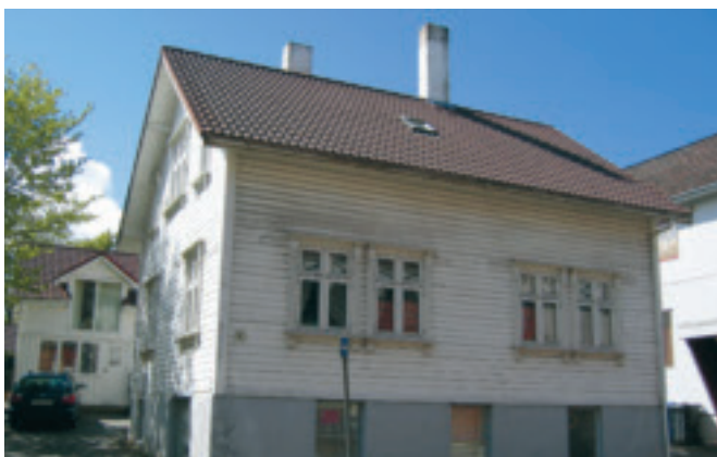
43. Oppheim - Fjogstadhuset i Meierigata, gnr. 1/99. Bustadhus frå byrjinga av 1900-talet. KPL