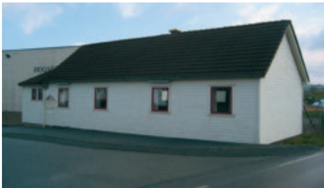
70. Hognestad forsamlingshus - gnr. 9/3 - vart bygd i 1885. KPL