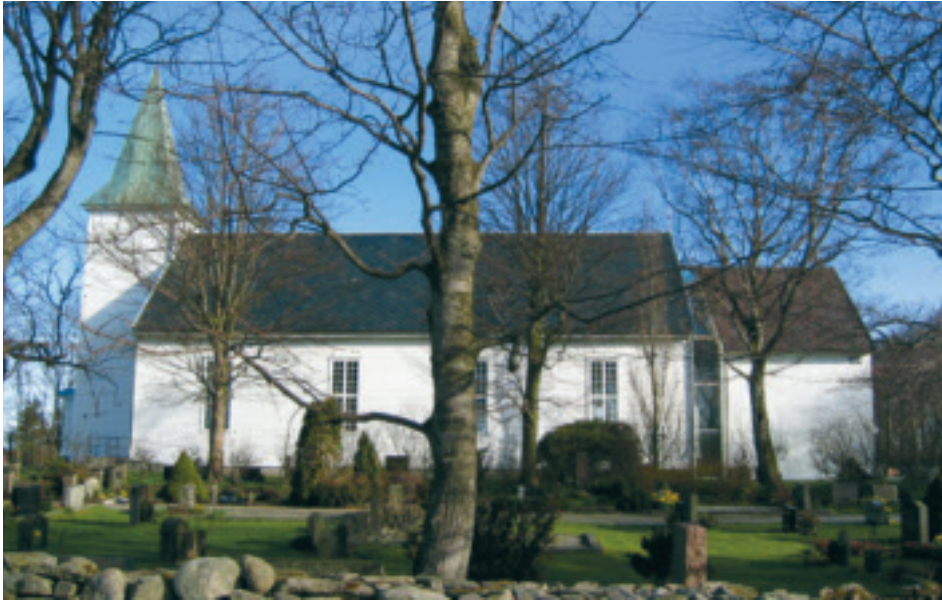
Time kyrkje med "Kyrkjetoget" til høgre