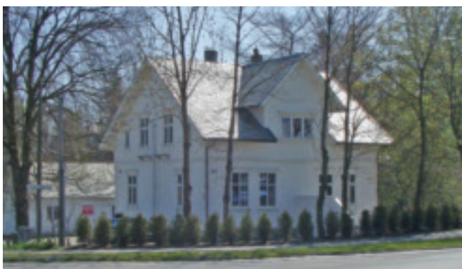
61. Dalheim - gnr.28/68 - særprega bustadhus i sveitserstil, bygt 1911. I seinare år har Trikantens barnehage halde til her. KPL