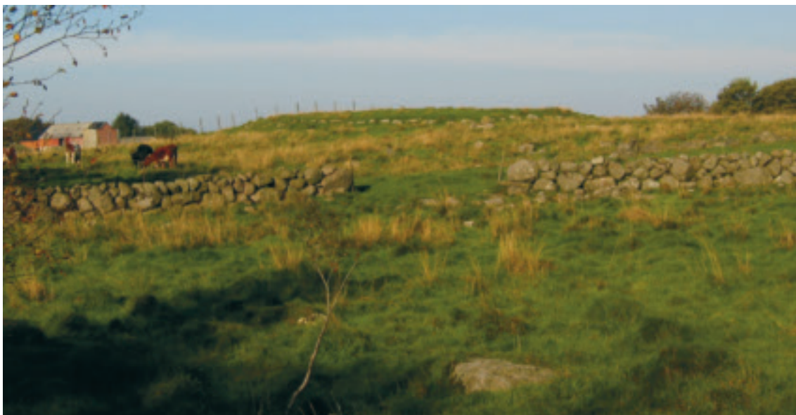
Tingvollen på Vestly