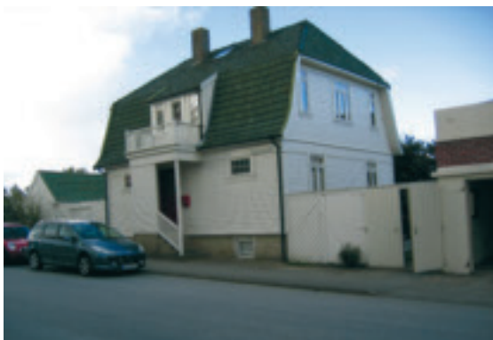
48. Soltun - bustadhus i Hetlandsgata - gnr. 2/39. Bygd 1918 av Martin Oma. KPL