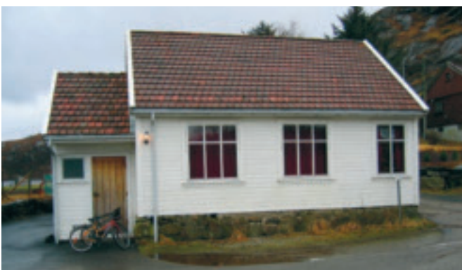
67. Tjåland grendahus - gnr. 47/9 - i enden på Tjålandsvatnet, vart bygd i 1890. KPL