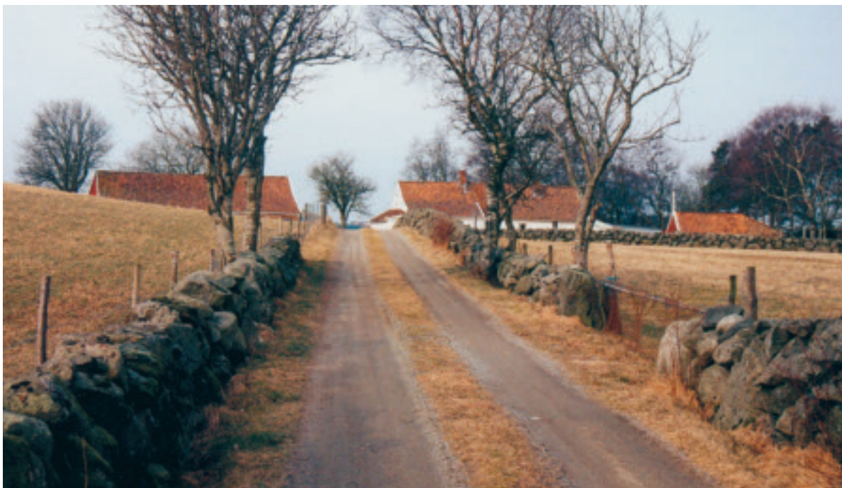
Geilen, tunet og steingardane rundt den dyrka marka på gnr 20 bnr 7 på Serigstad er eit godt døme på eit jærsk kulturmiljø

tid heilt oppdaterte. Time kommune vel difor å nytta databasane slik dei ligg føre, som ei informasjonskjelde som gir varsel om risiko for fornminne i eit område. Sjå liste i Vedlegg 2, pkt 5.