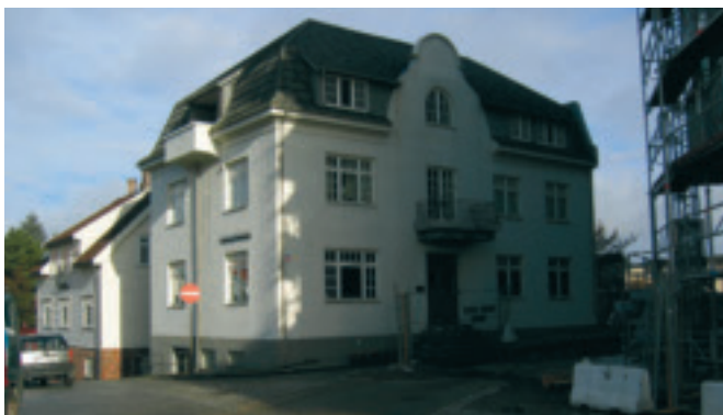
g. Grand Hotel, gnr 1/68 , tidlegare hotell og kafe, og butikklokale. Hulda Garborgs veg. SOB.