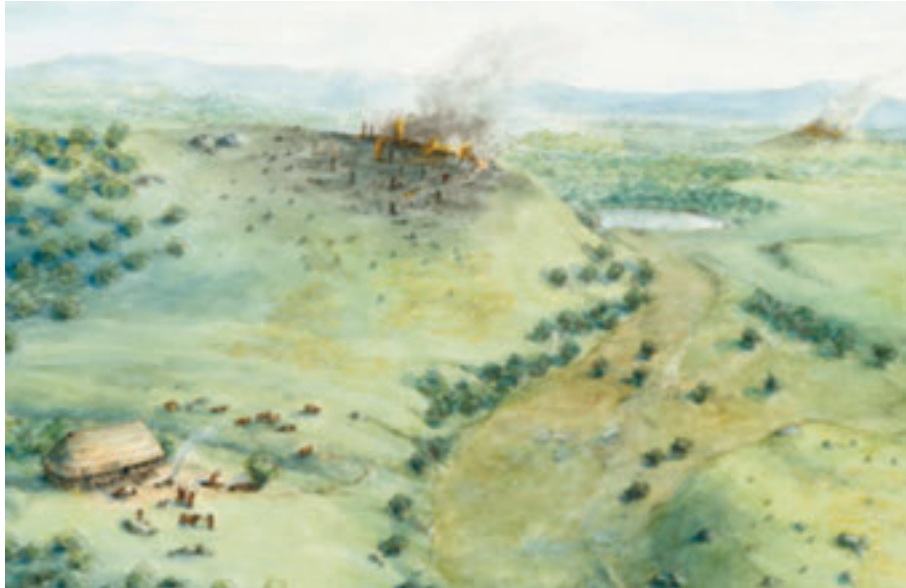
Kvålehódlane (Illustrasjon Eva Gjerde)