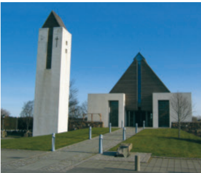
Det nye kapellet på Undheim, med klokketårnet i forgrunnen

Time kommune har som mål å medverka til at faste kulturminne knytte til tru og kristenliv blir tekne vare på.