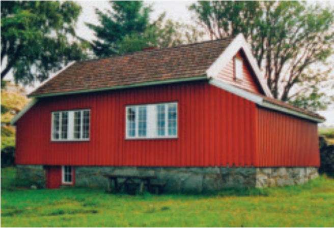
19. Knudaheio , Undheim, gnr. 46/21, obj. 1121/005/095. Sommarhuset til diktaren Arne Garborg. Bygd i 1899. Lite jærhus med 2 skutar. Autentisk grunnform og - plan. Til Time kommune i 1924. SEFRAK A