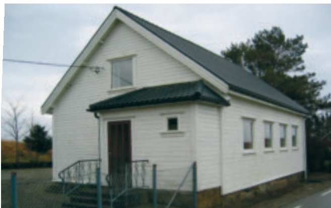
69. Line forsamlings- og bedehus - gnr. 5/3 - vart bygd i 1911. KPL