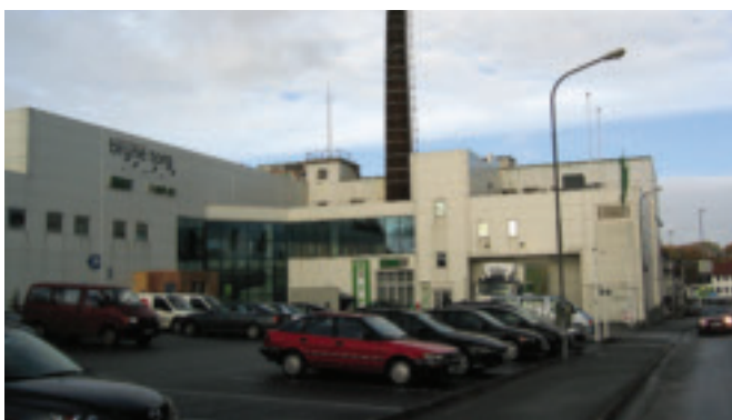
f. Jæren meieri med pipe , gnr 1/62. Jernbanegata 13, Bryne. Funksjonalisme. SOB.