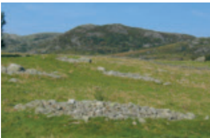
Hustuffer på Lyngaland

o Lyngaland på Sælland er frå ca 350 e. Kr. Her er 2 store hustuffer. Den største tufta er heile 64 meter lang, oppdelt i 5 rom. Det er funne om lag 4500 potteskår av mange ulike slag kar. Ein reknar med at garden vart nedlagd i slutten av 500-åra.