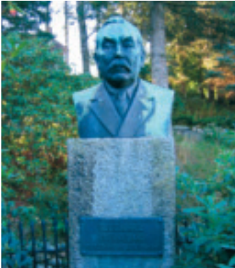
Byste av O. G. Kverneland - grunnleggjaren av Kvernelands Fabrikk.

Time kommune har ei rekke minnesmerke og monument, både i offentlig og privat eige. Det er eit mål å gjera innbyggjarane i kommunen kjende med bakgrunnen for desse, og å ta godt vare på dei.