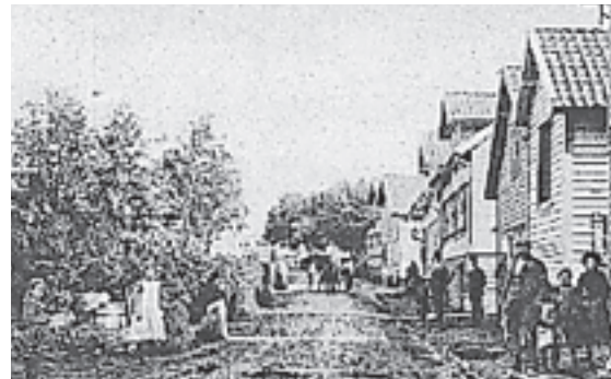
Desse bileta frå Thime Station (Bryne) tidleg på 1900-talet kan stå som døme på kva som er borte av såkalla identitetsberande miljø. Oppe til høgre er Bellesens hotell i