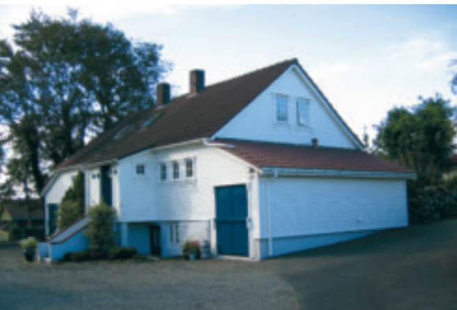
21. Jærhus - Rossaland på Bryne, gnr. 2/6, obj. 1121/007/005. Jærhus med to skutar. Bygd på 1800-talet. Nær på autentisk grunnform, plan ukjend. Restaurert. Kulturvernprisen 1999. SEFRAK A