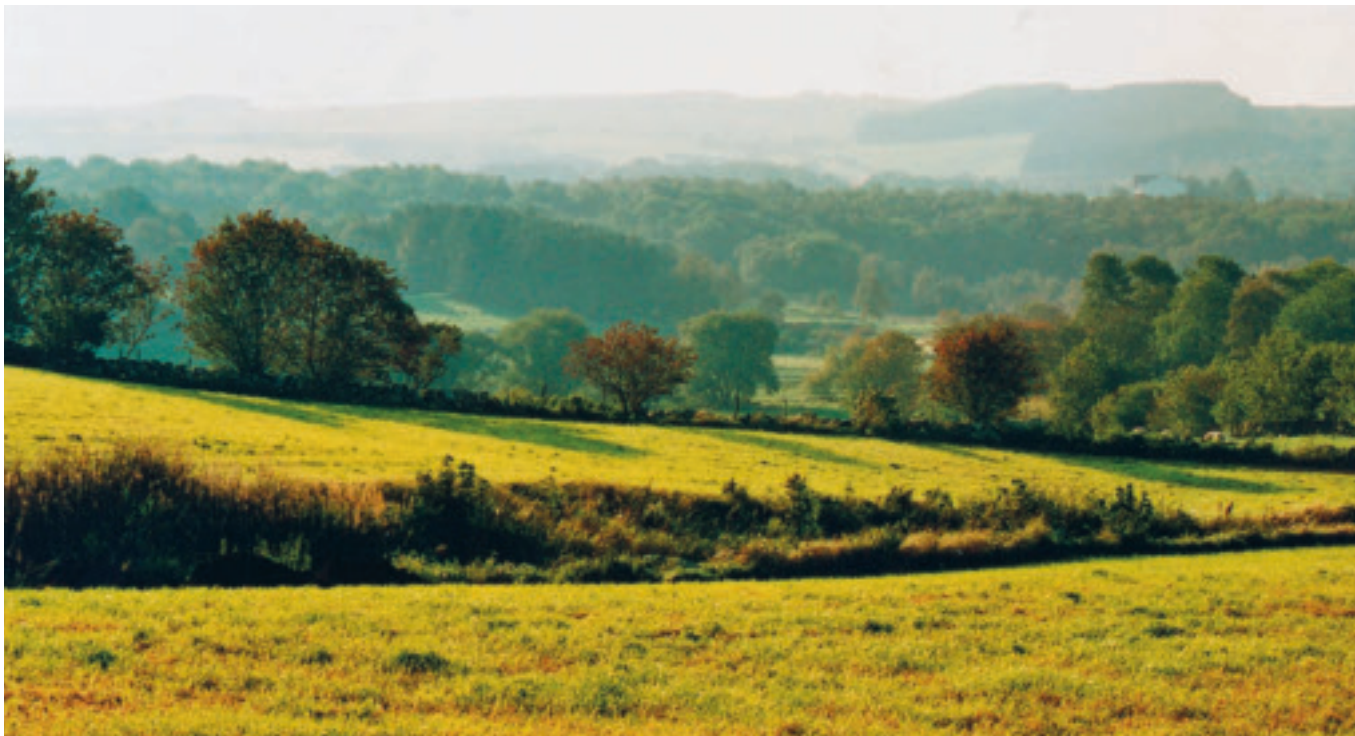
Mossige - Garborg mot Risa