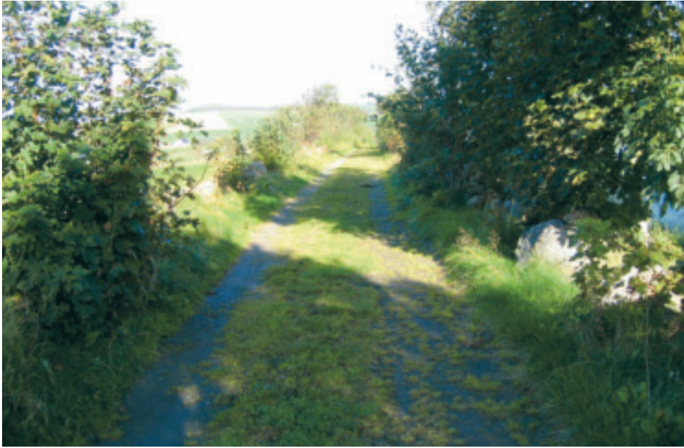
Frå ferdselsvegen Fosse - Tunheim