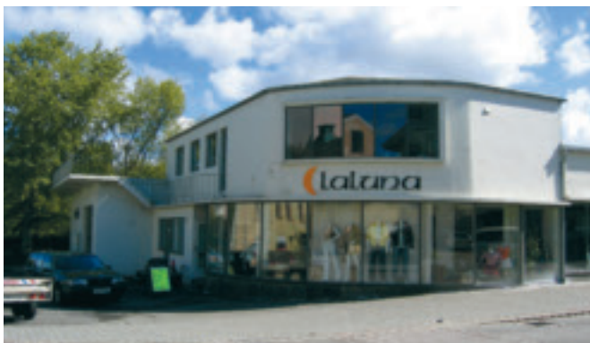
40. Storgata 41 , "Bolmehuset", gnr. 1/241. Bygd 1934. Opphavleg bensinstasjon, verkstad og smørjehall, med husvære i 2. høgda. Seinare forretningsbygg med kontor i 2. høgda. KPL