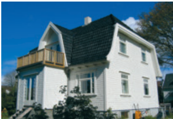
36. Natvighuset – bustadeigedom i Solhøgda, gnr. 1/206. Byggeår ukjent, truleg mellom 1910-1920. Restaurert av nåverande eigar.