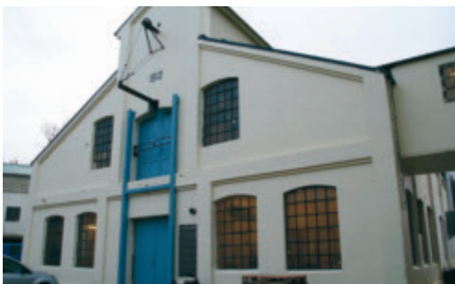
63. 64. og 65. Fabrikkbygningar ved Kvernlands Fabrikk - gnr. 28/171 på Kvernaland. Bygningane er frå 1895, 1913 og 1929, og er tidstypiske for kvar sin periode. KPL. Bygningane frå 1895 (63.) og 1929 (65.) går ut.