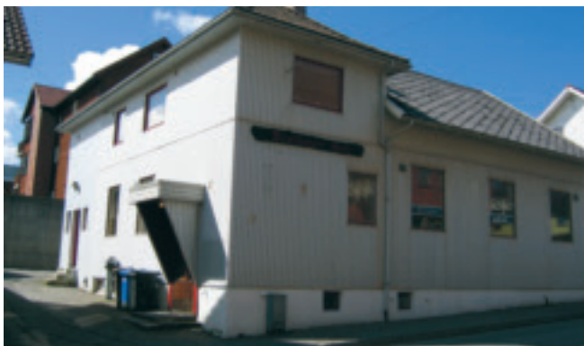
44. Sollyset - Tidlegare Frelsesarmeen - gnr. 1/131. Byggeår ukjent. Forsamlingslokale og bustad. KPL