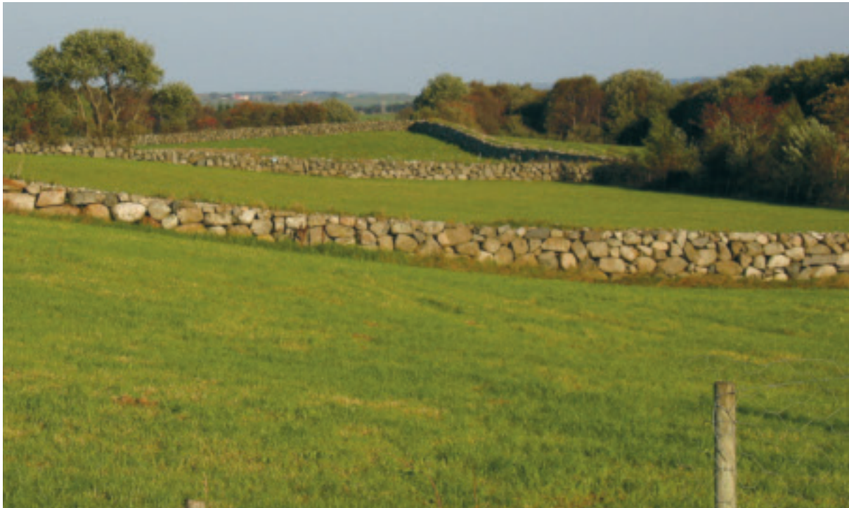
Moderne kulturlandskap på Lye