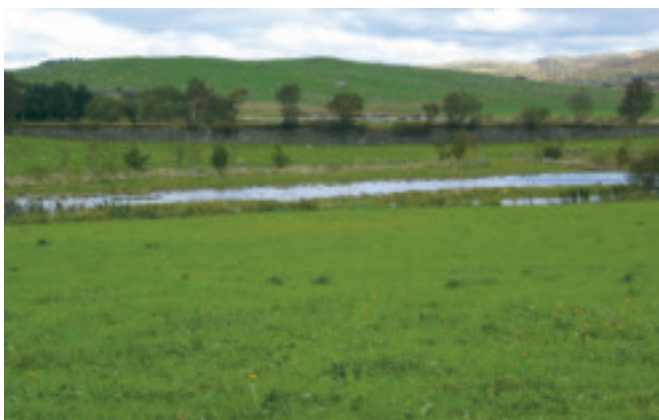
51. Demninga på Skrudland - gnr. 16/1 og 4 - vart bygd i 1915 i kilt stein, som dagsreservoar for Fotland kraftstasjon. KPL