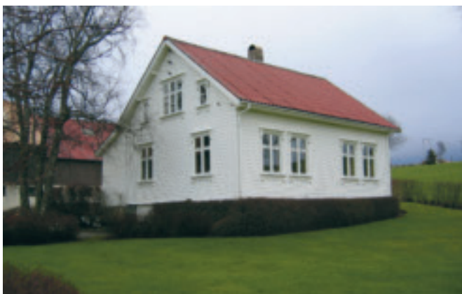
59. Tunheim - gnr.54/4 - gardshus, bygd i 1914. Godt bevart døme på sandneskassen, det første ferdig- huset på Jæren. KPL