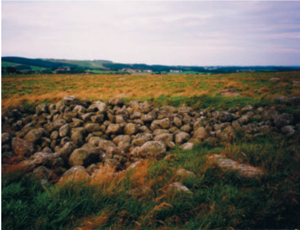
Mossigemarkene - Lendemyrane