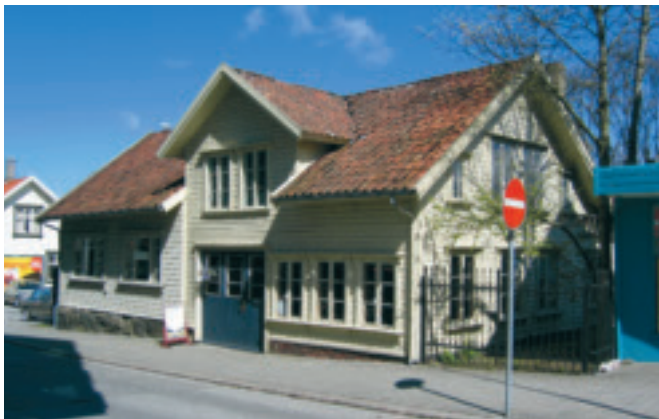
h. Smiå , gnr 1/28, Storgata 35, Bryne. Tidlegare bustadhus og smie. SOB.