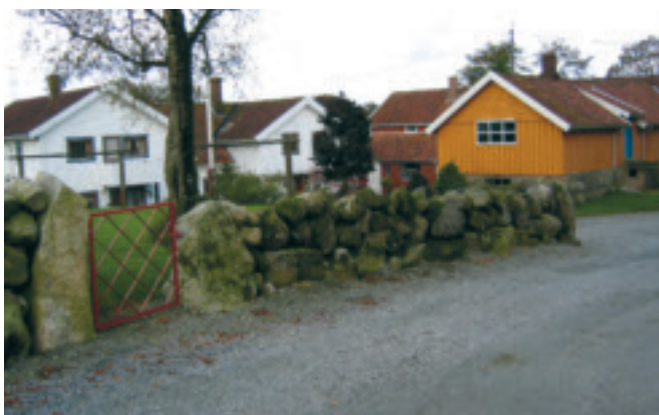
58. Norheimsgarden - gnr.19/1 - gardsanlegg med driftsbygning og våningshus, bygd 1840. Kulturvernprisen 2001. KPL