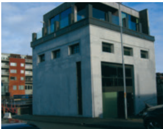
d. Spønehus og sveisehall , gnr 1/139, Herigstadvegen 10, Bryne Bygd ca 1930 og 1950 av Br. Hetland. SOB