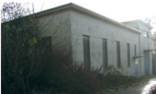
e. Trafo, gnr. 2/89 , gnr. 2/89, i Rektor Sælunds veg, Funksjonalisme. SOB