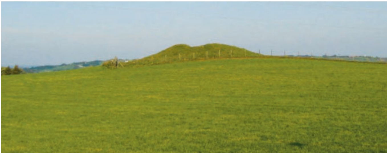
Bronsealdergravhaug på Vestly