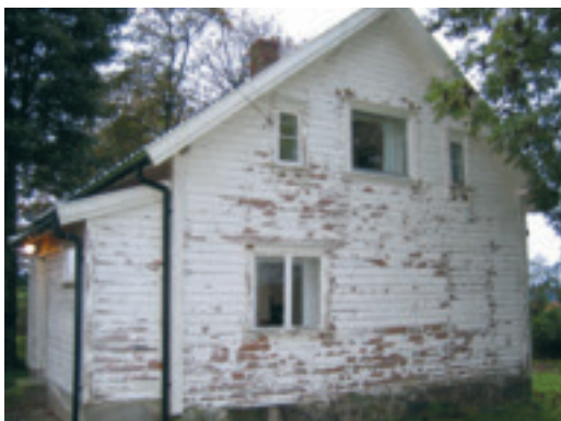
60. Botn - gnr.60/3 - gardshus, bygt ca 1910. Sandneskasse. Under restaurering (2008). KPL