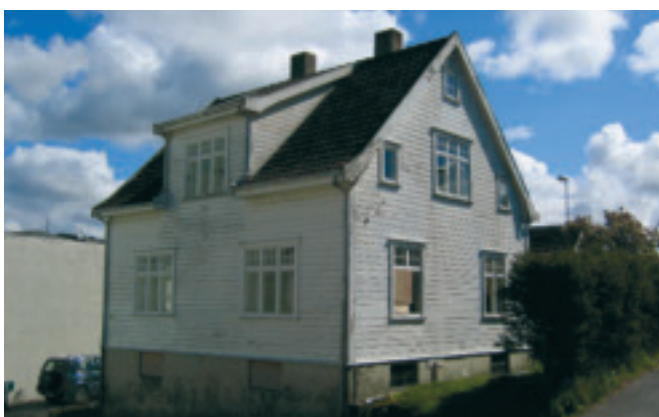
34. Sørli – bustadhus i Øgårdsbakken, gnr. 1/189. Bygd 1919. KPL