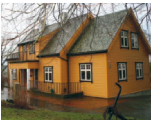
62. Hauabakken - gnr.28/103 - Kvernaland. Staseleg og stilreint bustadhus- bygd i 1926. Tidlegare direktorbustad, Kvernlands Fabrikk. Bustaden ligg i eit parkliknande miljø, med utsikt over Frøylandsvatnet. KPL Går ut.