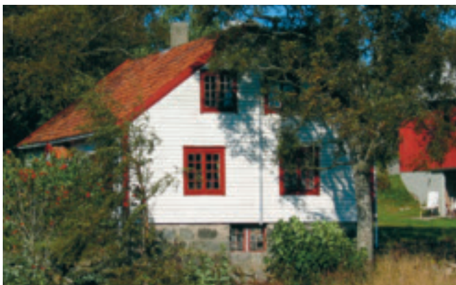
72. Norheim - gnr. 19/9 - vart bygd i 1872. Godt bevart jærhus utan skutar. Huset ligg vakkert til i gammel hage med steingard på framsida. KPL