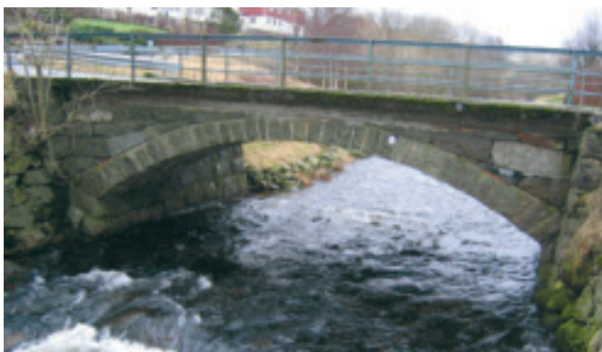
50. Undheim bru - gnr. 46 - bygd 1901. Steinbogebru i Undheim sentrum. Delvis skjult av dekket frå ny bru, som vart bygd over i 1959. Boge og brukar i kilt stein er heilt intakte. KPL