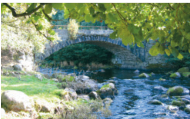
49. Fosse bru - gnr. 13 og 59 - mellom Oma og Fosse vart bygd i 1898. Brua har den største steinkvelven i enkeltspenn på Jæren KPL