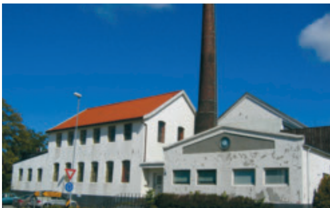
i. Holmen - bedriftsbygning og kontorlokale, gnr. 1/53 - i Bryne sentrum. Bygd som Jæderens Uldvarefabrik i 1896, modernisert i 1948. I Serigstadfamilien si eige som jordbruksreiskapsfabrikk og støyperi frå 1938 til det vart selt i 2004. Eldste industribygning i stasjonsbyen. Føreslege verna av Time kulturminnenemnd i 2004. SOB.