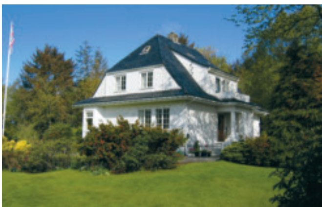
23. Bustadhus , Bryne, gnr. 2/43, obj. 1121/007/016. Bygd i 1919 i jugend/seinbarokk. Stor grad av autentsitet. Tidstypisk "finare" byarkitektur. SEFRAK A