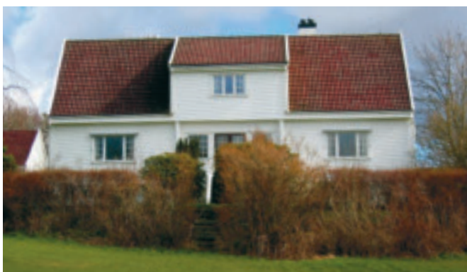
71. Time prestegard - gnr. 17/15 - vart bygd i 1932. Eigar er Den norske kyrkja. KPL