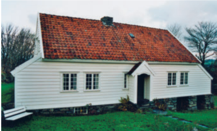
Garborgheimen er eitt av dei best bevarte jærhusa me har

serte på høgdedraga i det vide, opne landskapet, langs dei herskande vindretningane frå nordvest og søraust. Langveggen på stovesida vender ut mot havet og gavlveggene står opp mot vinden. Husa er funksjonelle, skuttane vernar sjølve veggen mot vêt og vind, samstundes som skråtaket hjelper vinden opp og over taket.