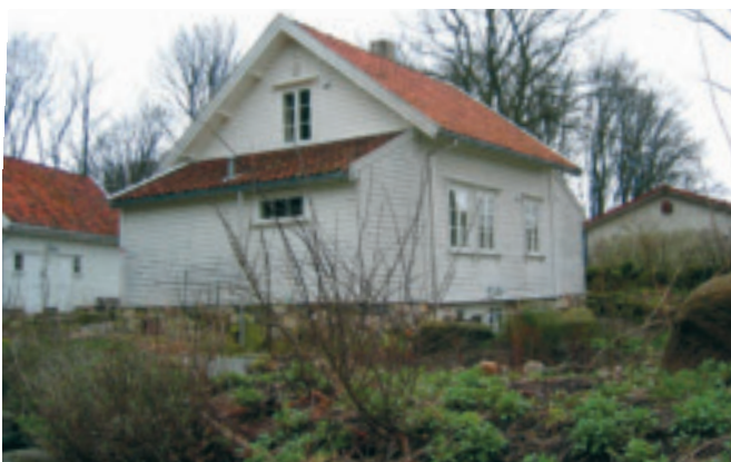
68. Arkjå - gnr. 9/69 - sandneskasse med påbygde skutar på Hognestad. Dette huset vart bygd på Undheim (Kålnes gnr. 46/57) i 1912, men vart flytta "på rot" og svært pietetsfullt restaurert på Hognestad i 2006. Uthus i same stil som huset. KPL