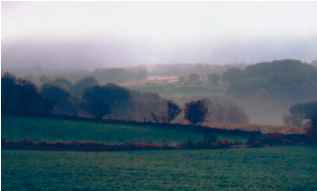
Frå kulturlandskapet ved Mossige - Garborg - Tjensvoll