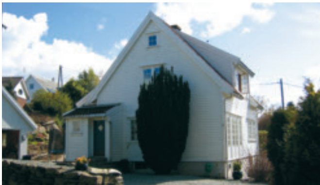
32. Varatun – bustadhus på Brynehaugen, gnr. 1/175. Bygd 1921. Restaurert av nåverande eigar, ved sivilarkitekt Per Line. Huset fekk Time kommunes kulturvernpris 1997. KPL