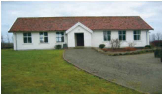
66. Vestly gamle skule - gnr. 22/29. Time kommune sin kulturvernpris 2002. KPL