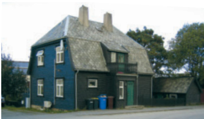
37. Steinborg – bustadhus i krysset Hetlandsgata/Rektor Sælands veg – gnr. 1/209. Bygd 1918 av Olav Lindland. KPL