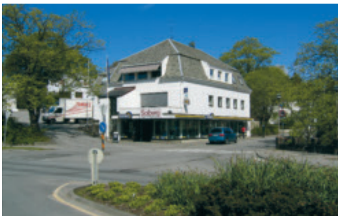
38. Brynevang – Festivitetten , gnr. 1/218. Bygd av Brynes Vel i 1926. Tidlegare kino- og festlokale, nå elektrisk forretning, kontor, verkstad og bustad. KPL