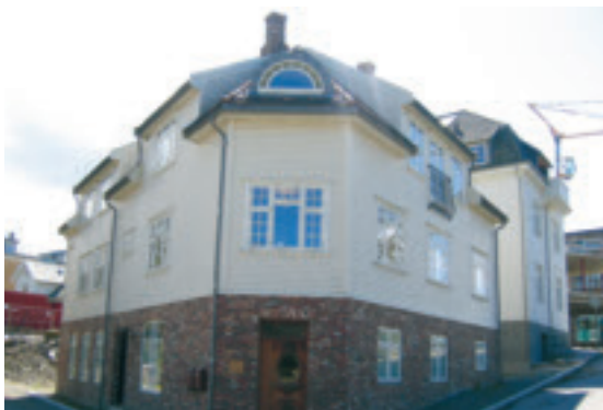
j. Nerdal - bustad- og kontorbygg i Bryne sentrum, gnr. 1/173. "Haualandshuset", etter tidlegare eigar, vart bygd i 1918. Teikna og bygd av byggmeister Reier Time. Tidlegare husvære, frisørsalong og kafe, nå kontor og utleigehusvære. Gjennomgåande restaurert av Reier Carlsen. Kulturvernprisen 2003. SOB.