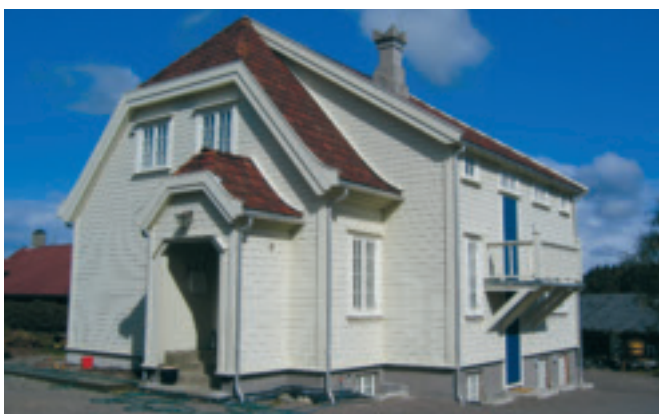
45. Heimly - Lendehuset, gnr. 2/23. Bygd 1917 av stasjons- og postmeister Jens Lende. Staseleg hus som nå er utvendig restaurert av nåv. eigar. KPL