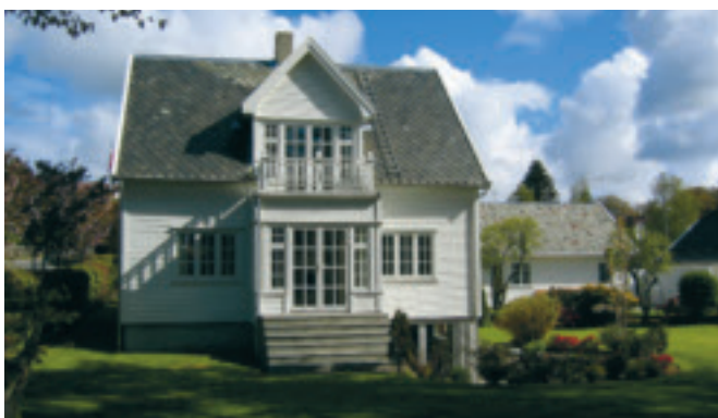
33. Norderhov – Dahlhuset – bustadhus i Solhøgda, gnr. 1/178. Byggeår ukjent. KPL