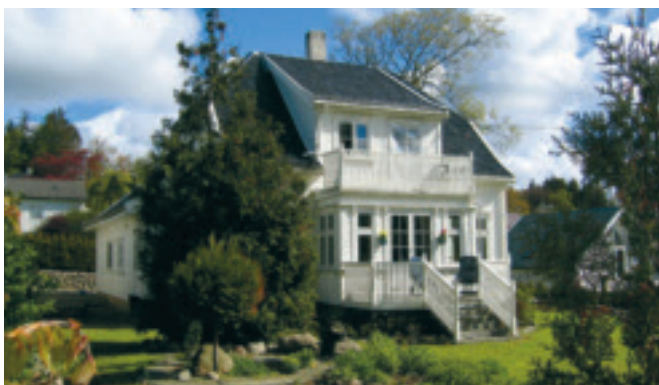
46. Brynevoll - Haugehuset i Solhøgda-kvartalet, gnr. 1/177. Bygd ca 1920. KPL