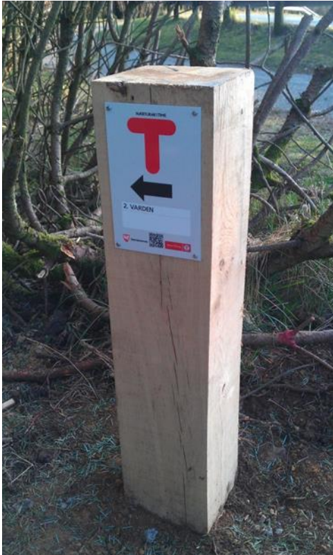
På veg til Varden på Lyefjell – på merka sti

I arbeidet med revisjon av arealdelen har ikkje kommunen sett det som formålstenleg å leggja omsynssone rundt friområde utanfor tettstadane.