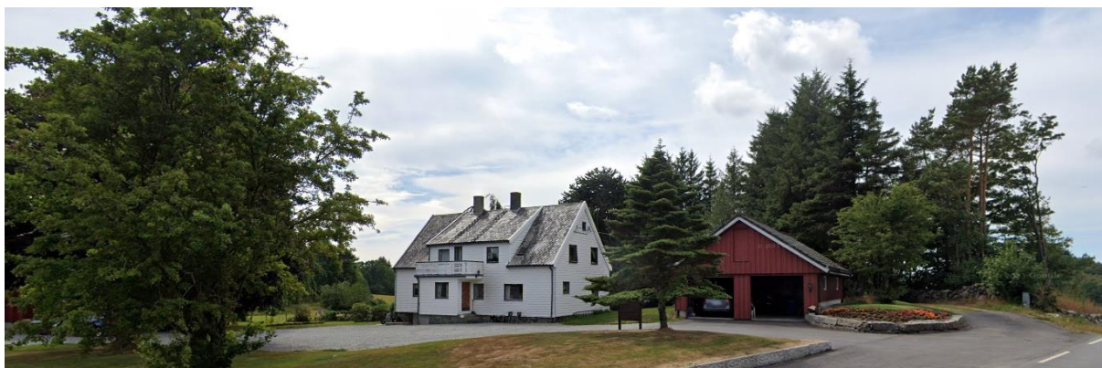
Figur 2-1. Våningshus fra siste del av 1800-tallet på Kalberg sør.

I influensområdet er det kjent mange kulturminner og kulturminnelokaliteter fra både forhistorisk tid og nyere tid. Dette er i hovedsak kulturhistorisk jordbrukslandskap med gravfelt, gravminner og bosetning- aktivitetsområder fra jernalder.