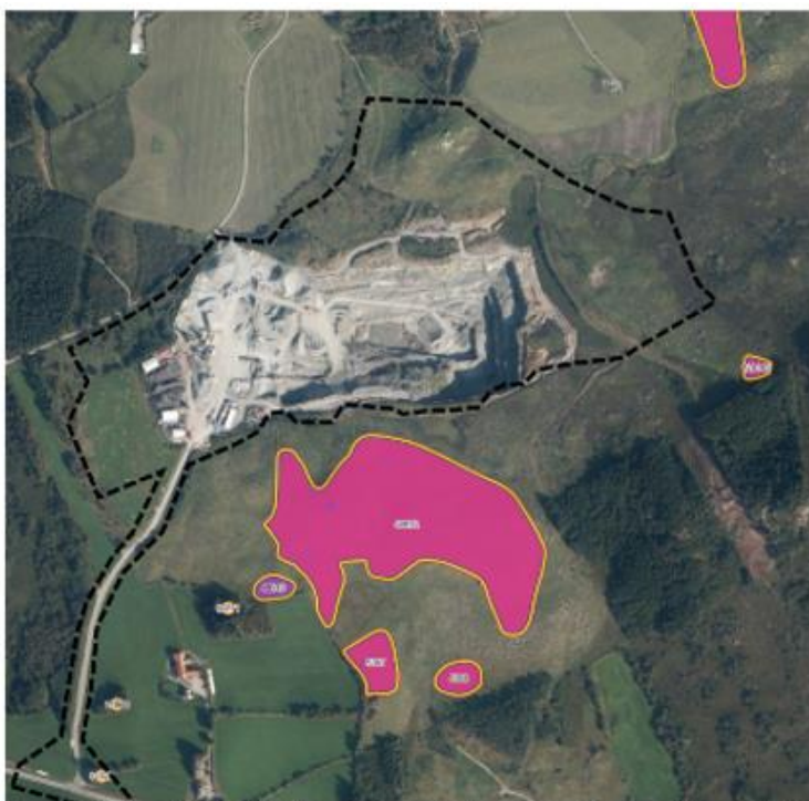
Figur 9. Automatisk freda kulturminner og kulturvernområder ved planområdet. Figur 1-1. Illustrasjon fra planprogrammet.

Etter dialog med fylkeskommunens kulturseksjon i høringsfasen er det avklart at kulturminnet i sør ikke vil inngå i planområdet når planforslaget utarbeides, da det ligger utenfor frisktsonen. Planen berører dermed ingen kjente kulturminner eller kulturmiljø direkte.