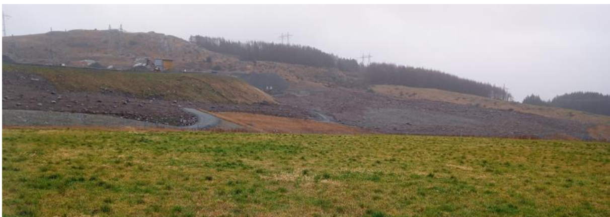
Figur 7: Massedeponi, fordrøyningsdam og anleggsområdet ved nye Fagrafjell transformatorstasjon, øst for planområdet. Foto AV 2022.

På Varden, nord for planområdet, ligger det et automatisk fredet gravfelt (Id 34828) og et automatisk fredet gårdsanlegg (Id 44847). Disse lokalitetene ligger samlet i tilknytning til tunet på Nordre Kalberg. På Fagrafjell ligger et automatisk fredet gårdsanlegg (Id 5150), som utgjør en stor sammenhengende kulturminnelokalitet som strekker seg fra Møgedal over Sandskallen og frem på kanten mot Kalberg.