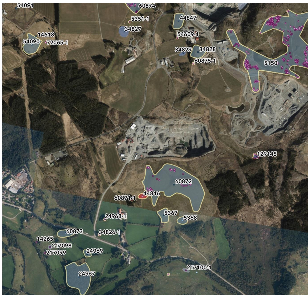
Figur 2-2. Registreringskart automatisk fredete kulturminner.

Det er ikke SEFRAK-registrerte bygninger innenfor planområdet, men i influensområdet er det registrert en verneverdig bygning knyttet til gårdsbruket på Kalberg søre, med våningshus fra siste del av 1800-tallet (SEFRAK-nr. 11210006088).