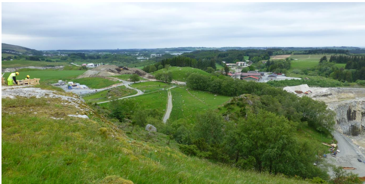
Figur 2-8. Kulturminner og kulturmiljø i influensområdet nord for den planlagte utvidelsen av masseuttaket er betydelig berørt av tiltak, Statnetts transformatorstasjon og linjenett, deponier og masseuttak Kalberg nordre. Foto, AV juni 2019.