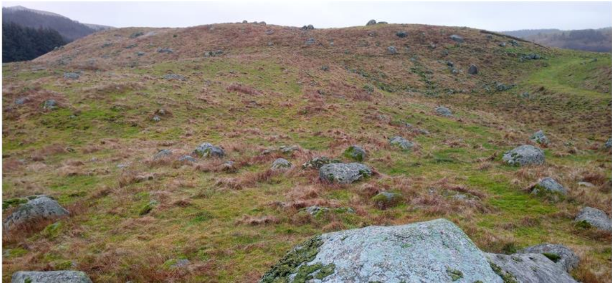
Figur 4: Det store kulturminneområdet sør for planområdet.