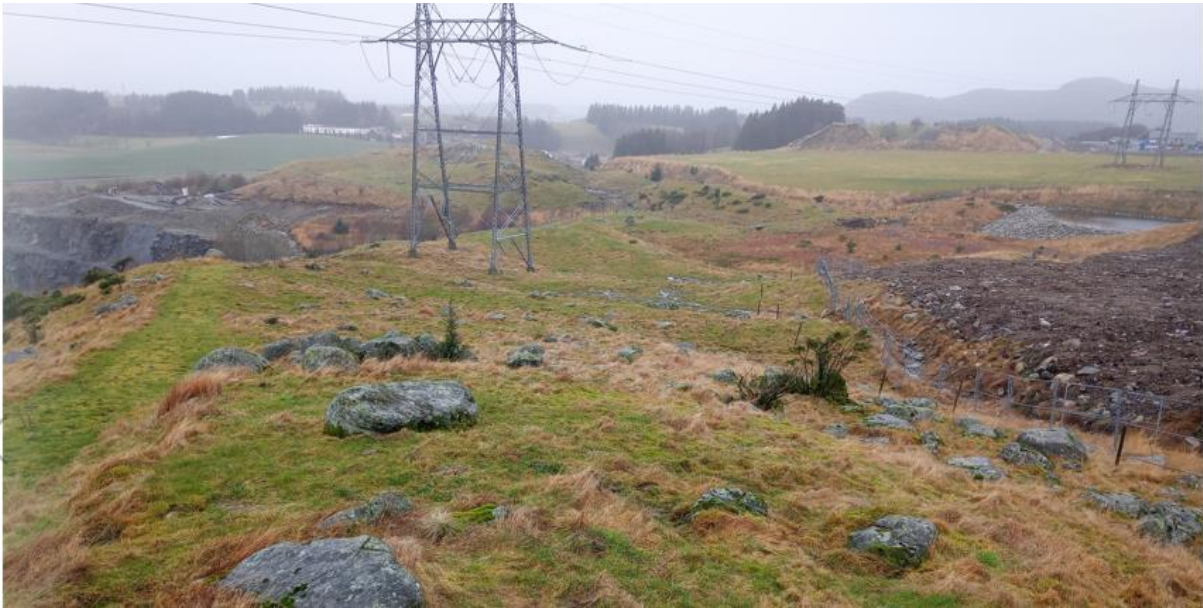
Figur 6: Området for den planlagte utvidelsen av masseuttaket mot øst. Til venstre eksisterende uttak, i midten det aktuelle utvidelsesområdet og midlertidig 300 kV linje, til høyre massedeponi og fordrøyningsdam for Fagrafjell- anlegget.

På Varden, nord for planområdet, ligger det et automatisk fredet gravfelt (Id 34828) og et automatisk fredet gårdsanlegg (Id 44847). Disse lokalitetene ligger samlet i tilknytning til tunet på Nordre Kalberg. På Fagrafjell ligger et automatisk fredet gårdsanlegg (Id 5150), som utgjør en stor sammenhengende kulturminnelokalitet som strekker seg fra Møgedal over Sandskallen og frem på kanten mot Kalberg.