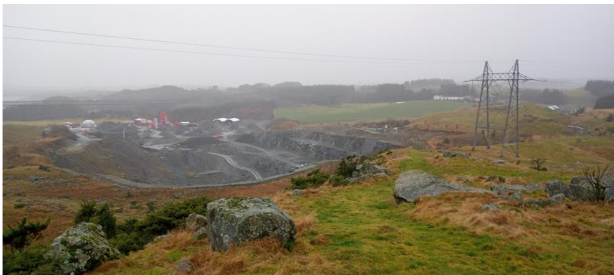
Figur 2-5. Planområdet sett fra øst.