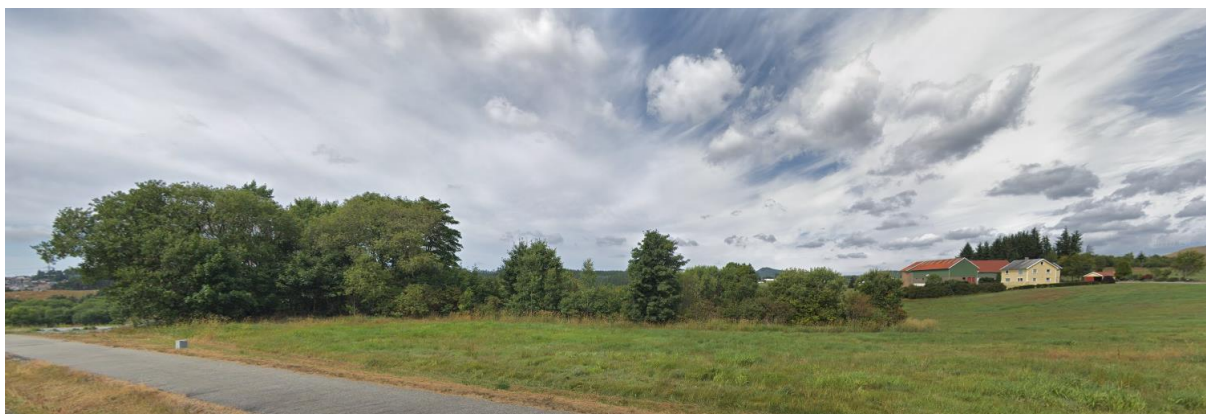
Figur 2-3. Gravhaugen (Id 34826) ved kryss mot Åslandvegen ligger i skogholtet til venstre i bildet.

Nærmest planområdet i øst er det registrert en automatisk fredet rydningsrøyslokalitet (Id 129145). På lokaliteten er det registrert tre rydningsrøyer, to gravrøyer og en tuft. Like sør for planområdet, ved kryss mot Åslandsveien, ligger det et automatisk fredet gravfelt med tre gravhauger (Id 60873) og gravhaug (Id 34826). Sistnevnte lokalitet ligger like utenfor planområdet (frisiktssone). Nord for denne og vest for gårdstunet på bruk 2 på Søre Kalberg ligger det enda en automatisk gravhaug (Id 24968). Vest for gårdstunet på bruk 1 ligger det to automatisk fredete gravfelt. Det ene gravfeltet består av fire gravhauger og en hustuftrest (Id 24969) og det andre på Kalberglunden består av fem langhauger, tre rundhauger og et gardfar (Id 24967).