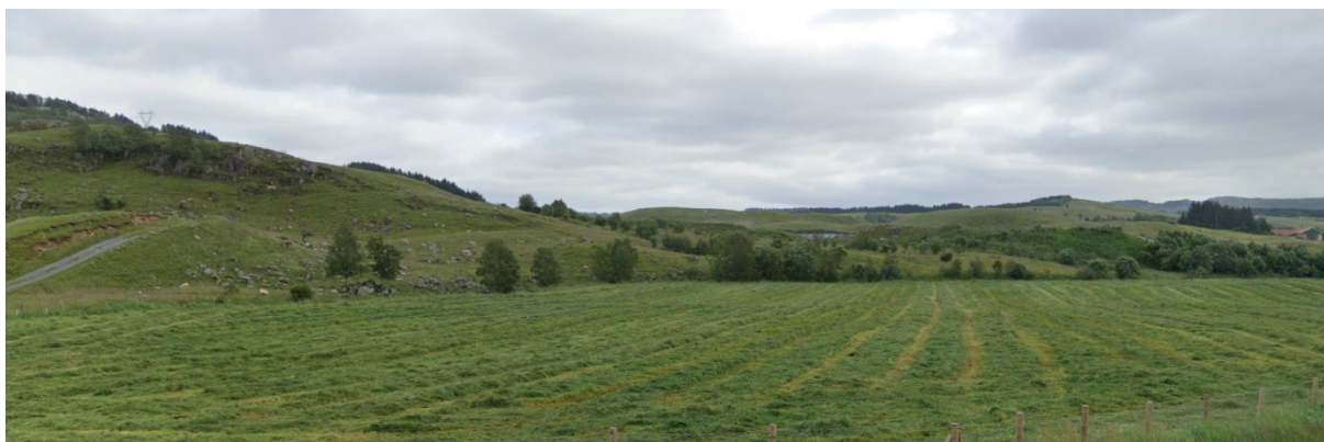
Figur 3-1. Oversiktsbilde over eksisterende masseuttak og området for utvidelse i nord og øst.

Tiltaket vil samlet medføre noe miljøskade for kulturmiljøet på Kalberg, vurdert til stor verdi. Kulturmiljøet, som i hovedsak ligger utenfor planområdet, blir i noe grad visuelt berørt.