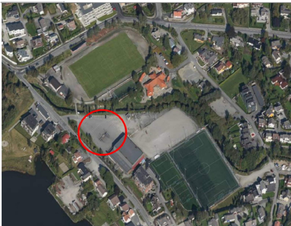
Utsnitt frå Skråfoto 2014. Regulert symjehalltomt er vist med raud sirkel.

Frøyland IL har gjeve uttrykk for at de har andre planar for denne tomte. I dag vert området nytta til parkering. På den regulert parkeringsplassen er det opparbeida ein grusbane.