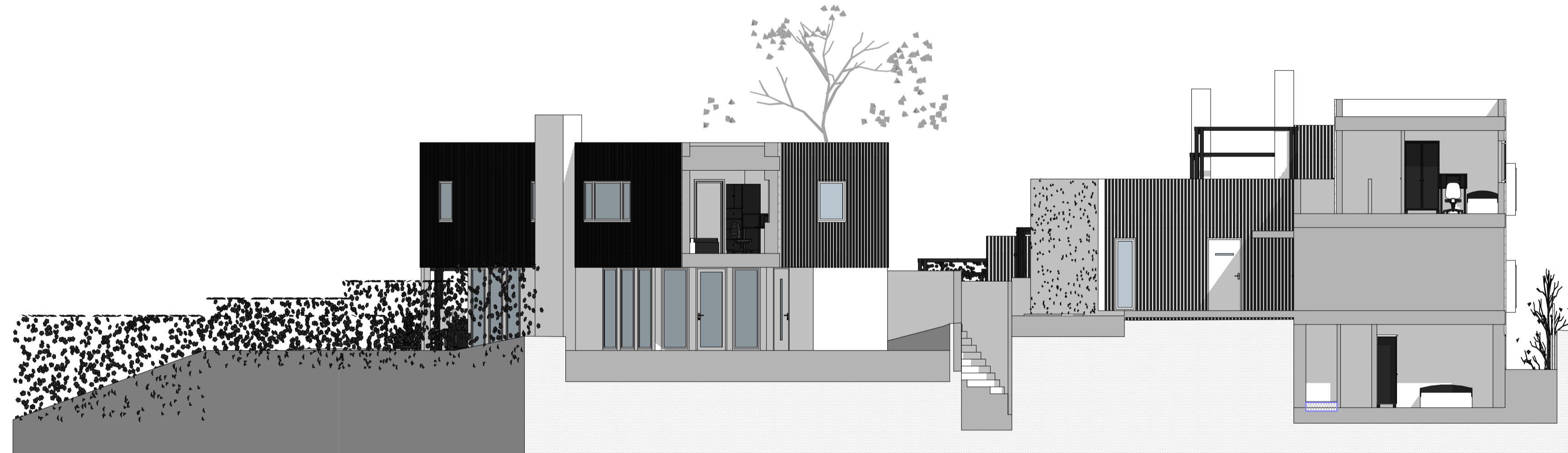
Øst Fasade tilbygg 1:100