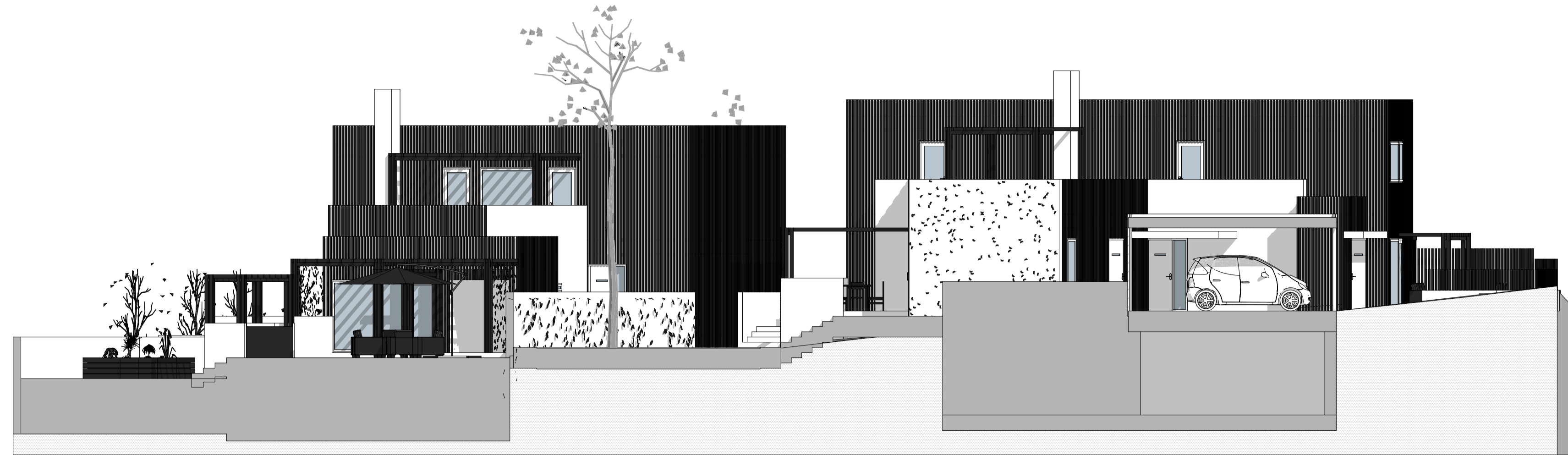
Sør Fasade tilbygg 1:100