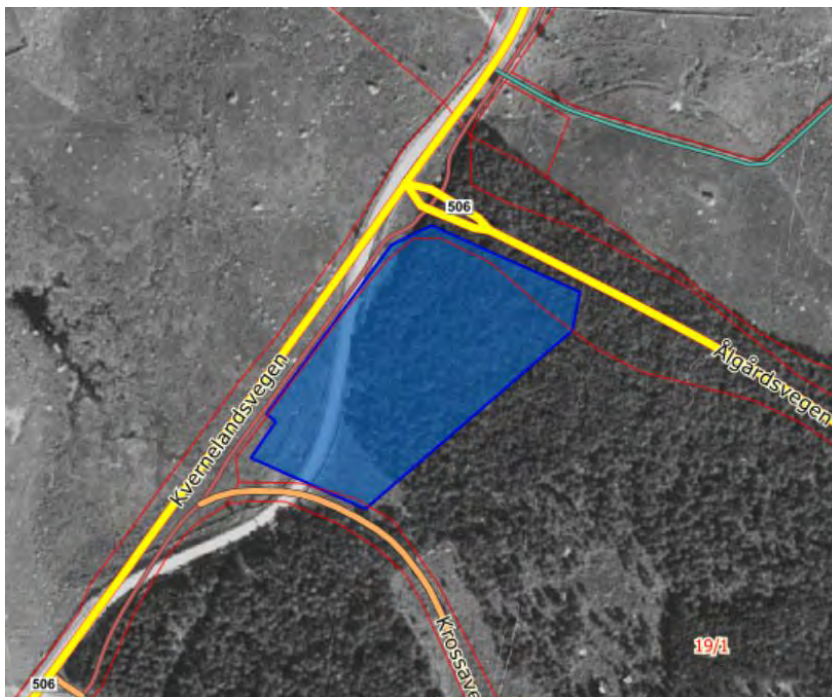
Figur 3: Kartet synar den tidlegare vegbanen til Kvernelandsvegen. Dagens sykkelsti og vegar er teikna opp i gult og oransje. Planområdet er markert med blått.

Grunneigar informerte før registreringa at Kvernelandsvegen tidlegare har gått igjennom delar av området. Dette er synleg på eldre flyfoto av området.