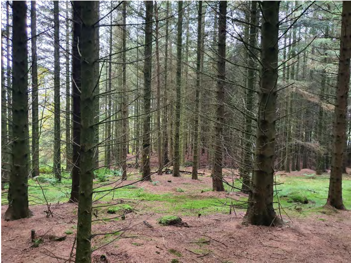
Figur 4: Lengst frem i bildet kan ein sjå at terrenget flatar ut; her har Kvernelandsvegen tidlegare gått. Biletet er tatt mot vest.

Området vart overflateregistrert med hjelp av jordbor for å sjå om det var spor etter synlege kulturminne. Planområdet består av barskog og hovudsakleg bar bakke, der terrenget heller svakt mot sørvest og vest. I vest, der den tidlegare vegen har gått, flatar terrenget ut og det er eit par meter med asfalt synleg inne i skogen. Det er usikkert om dette er frå vegen eller andre inngrep. Det vart ikkje gjort funn av automatisk freda kulturminne innanfor området.